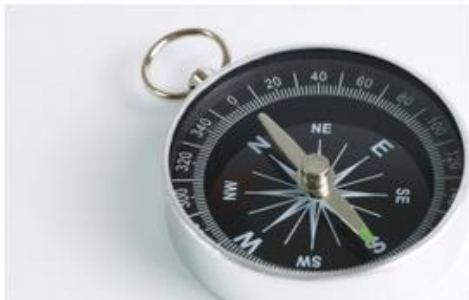
Einführung in IT-Sicherheit und Recht